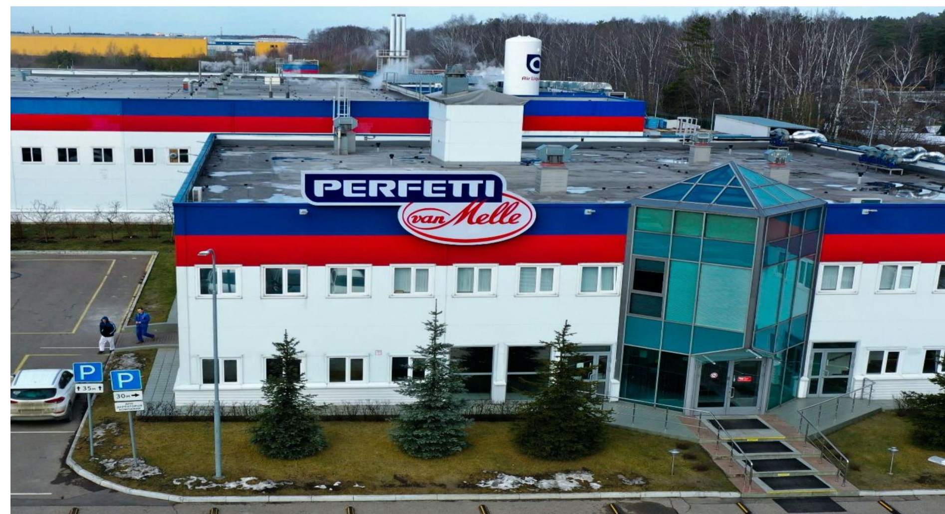
Строительство второго производственного корпуса ООО «Перфетти Ван Мелле»

Для инвестора - экономия 8,5 % от общего объема инвестиций